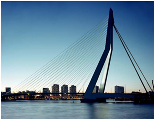
Obr. 4: Termomechanicky válcované plechy Dillinger Hütte jakostí S355 M/ML tloušťky až 140 milimetrů umožňují náročné konstrukce mostů.

Obr. 1-4 Obr. 5