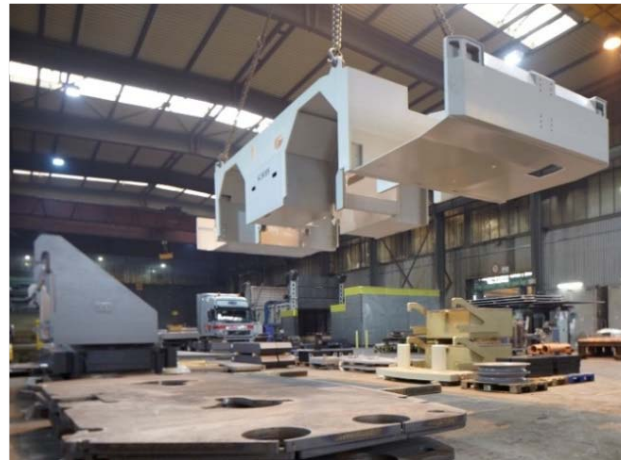
Obr. 7: Integrovaná kompetence firmy Jebens GmbH pro výrobu složitých, k zamontování připravených konstrukčních skupin.

Obr. 6 Obr. 7