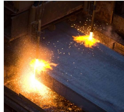
Obr. 3: Základem silných plechů Dillinger Hütte jsou ocelové bramy maximální čistoty.