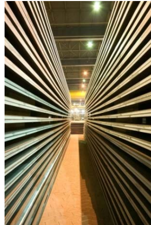
Obr. 2: Svazky plechů ve válcovně hrubých plechů Dillinger Hütte.