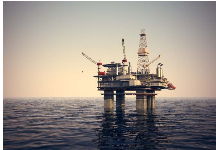
Obr. 5: Termomechanicky válcované plechy Dillinger Hütte pro pobřežní aplikace.

Rádi Vám e-mailem zašleme tyto či další motivy v rozlišení způsobitelném k tisku.