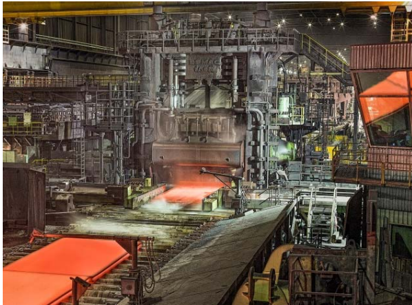
Obr. 1: Mohutná válcovací stolice v Dillingenu válcuje homogenní plechy díky velké redukci tloušťky a tváření v jádru plechu.

Dillinger Hütte představuje na MSV v Brně silné plechy dosud nedosažené tloušťky